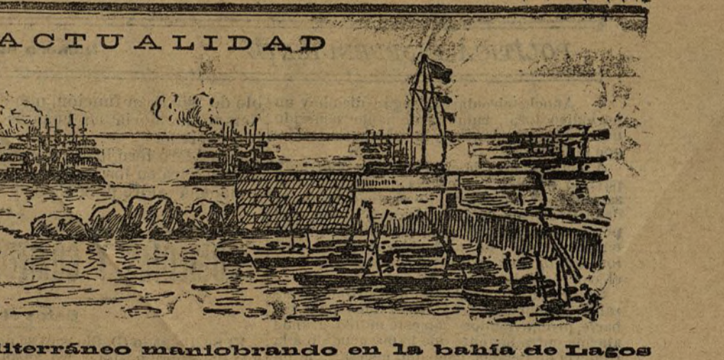
La escuadra inglesa del Mediterráneo maniobrando en la bahía de Lagos

En ensayo las obras nuevas tituladas Los hijos del mar y La visión de fray Martín . En la presente semana estreno de Las barcas , de Escalante y Feichó. Venus-Salón y las ya célebres seguidillas de fray Domingo en El famoso Colón , continúan llenando el teatro todas las noches.