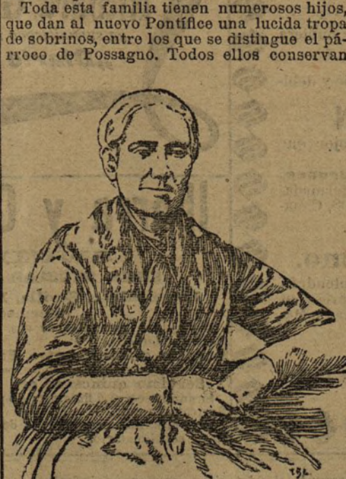
La madre de Pío X

Toda esta familia tienen numerosos hijos, que dan al nuevo Pontífice una lucida tropa de sobrinos, entre los que se distingue el párroco de Possagno. Todos ellos conservan