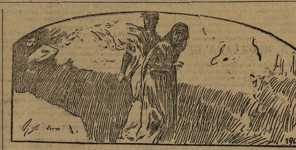
Parte superior del cuadro de M. Benedito, titulado «Canto VII de la Divina Comedia».

Entre varias cosas malas, nótese en este cuadro de Alvarez una manera de pintar las ropas que sorprende. ¿Qué ironías en las vestiduras de las bacantes, y qué modo de dibujar! También Alvarez de Solomayor ha tenido calificación honorífica. Verdad que igual concesión se ha hecho a casi todos los pen-