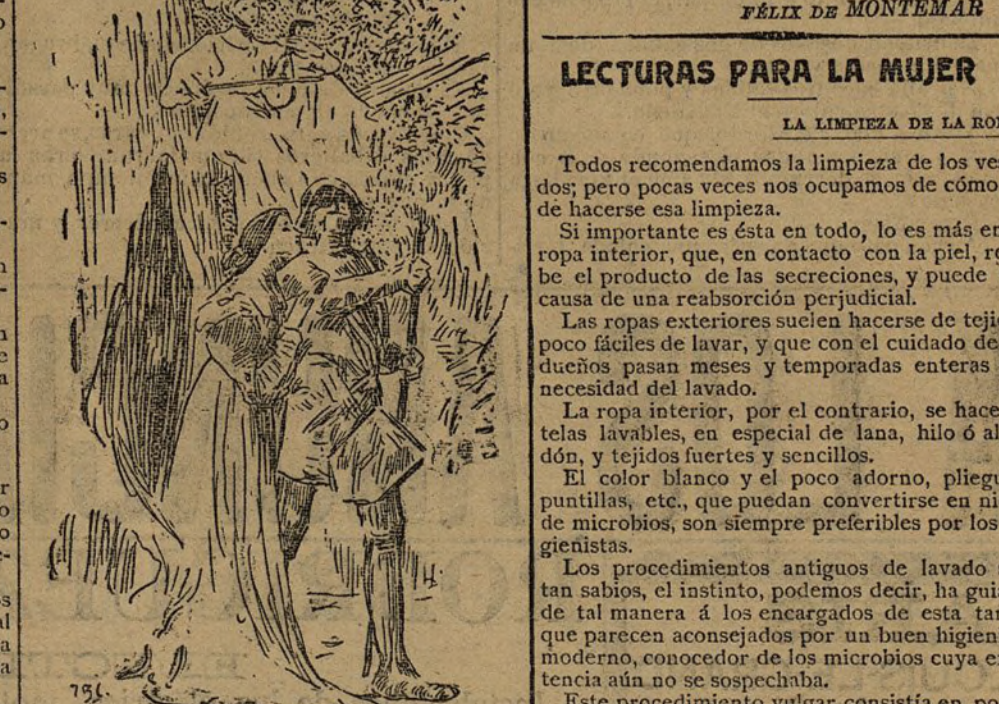
Figuras principales del cuadro «Reinaldo en el bosque encantado».

Chicharro (D. Eduardo). —Un cuadro no muy grande que representa a Reinaldo en el bosque encantado . Aquí Chicharro está tan lejos de su prueba de suficiencia del año anterior, que es una pena. El cuadro éste, ejecutado por procedimiento semejante al de Raffelli, dibujó a manera de pastel, es de una tonalidad