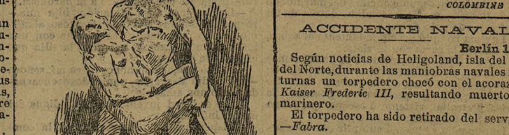
«Misericordia»: grupo escultórico, de D. E. Marín.

Enmas, y una cabezita de viejo. Son dos obras que agradan, sin prestarse a mayores extremos.