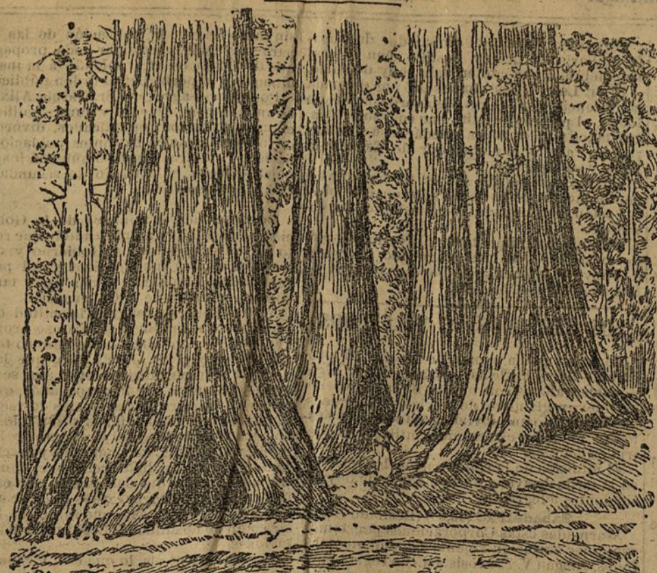
Grupo notable de Sequoias denominado «El soltero y las tres gracias».

California es el país de los grandes árboles y de los grandes bosques. Con su clima privilegiado, semitropical, templado unas veces por los vientos del Pacífico y otras por las brisas del golfo de México, ofrece a la vegetación condiciones extraordinarias de desarrollo, de vigor y de vida.