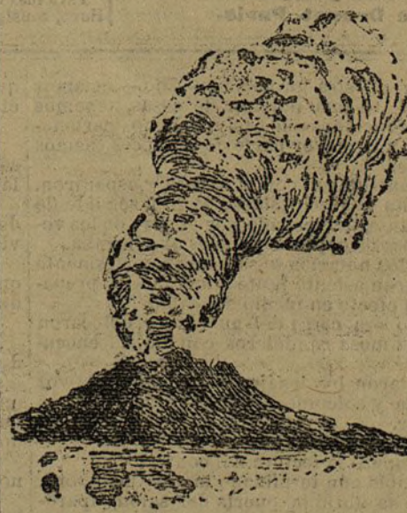
Aspecto del volcán en estos días