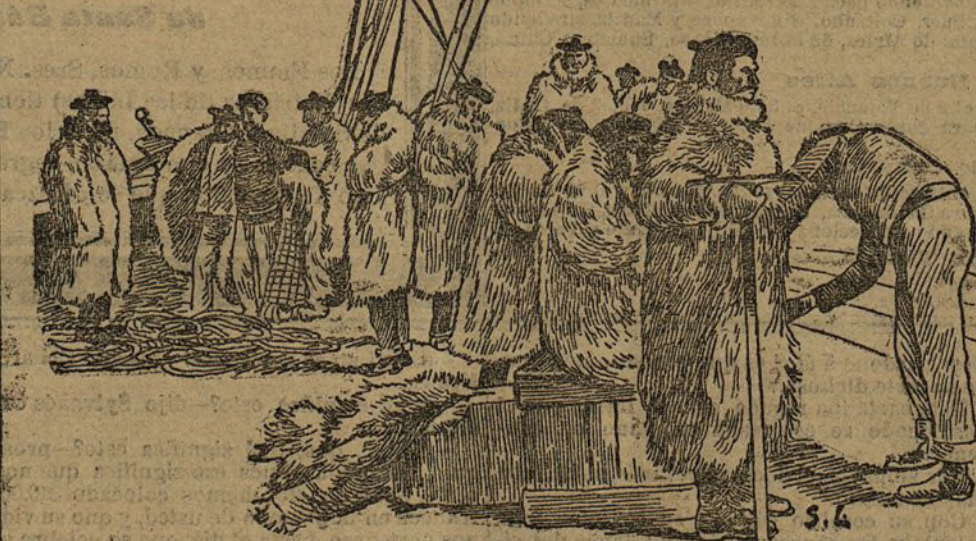
Los marineros en el traje polar

Su distribución interior está exenta de lujo.