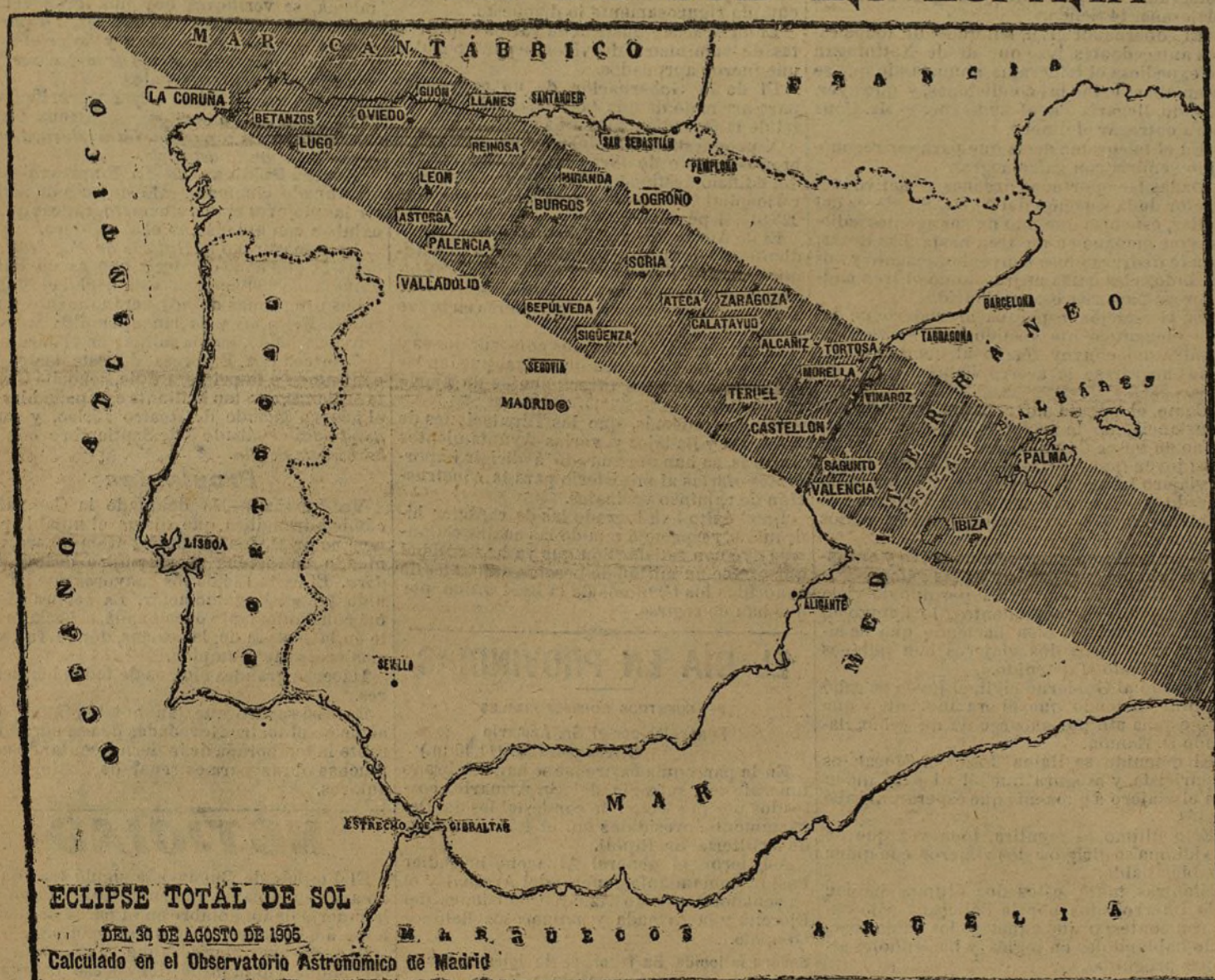
ECLIPSE TOTAL DE SOL DEL 30 DE AGOSTO DE 1905 Calculado en el Observatorio Astronómico de Madrid

Fresco está aún en la memoria de todos el eclipse total de sol de 1900. ¿Quién no recuerda el movimiento extraordinario que en España se produjo? Tuvimos una irrupción de extranjeros, y la Prensa europea habló entonces de España tanto, por lo menos, como en tiempos de la guerra. Los turistas franceses, con flammaria a la cabeza, invadieron Elche. Irlandeses, ingleses, franceses, alemanes, algún que otro ruso, etc., se instalaron en Plasencia, en Argamasilla, en Hellín, en Navalmaral y en otros puntos. Pocas veces se ha visto España más honrada y, digámoslo con satisfacción, pocas veces más elogiada. Por aquel entonces, durante un mes se cobró en un pueblo a una reducida Comisión francesa, 1.000 pesetas.