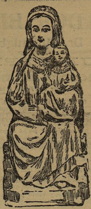
Imagen de Nuestra Señora del Puy

Además de la iglesia de San Miguel, cuya puerta románica ofrece un gran interés artístico, y cuya ornamentación es de una riqueza