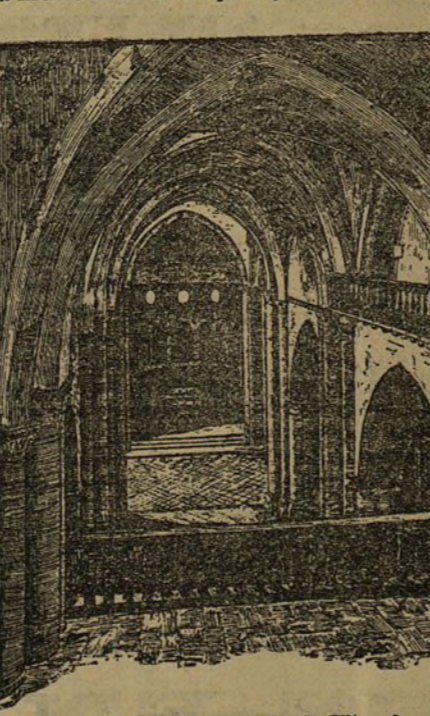
Interior del Monasterio de Hirache

El celeberrimo Monasterio de Hirache, que también hoy habrá visitado el rey, se halla situado en la falda septentrional de la sombría montaña de Montejuirra, en el valle de la