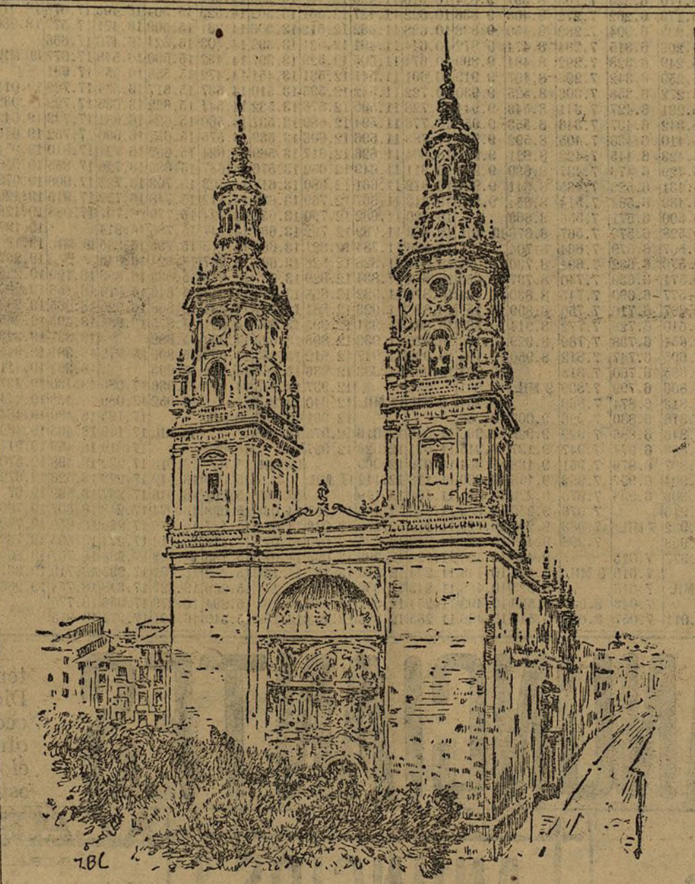
Nuestra Señora de la Redonda, donde se cantará el Te Deum á la llegada del rey á Logroño

Las cuentas corrientes han subido 4.177.260 pesetas, elevándose su cifra á 618.523.679 pesetas, y las cuentas corrientes oro han tenido alguna baja. Los depósitos en efectivo im-