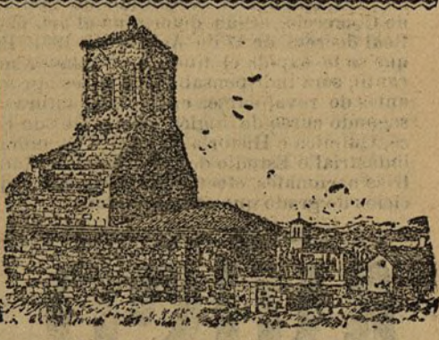
Ruinas de Santa Cruz de la Espada, en el camino que conduce a San Juan de la Peña a Jaca

AGRICULTURA.—Reales órdenes resolviendo expedientes de condona de multas de las Empresas de los ferrocarriles Andaluces y del Norte.