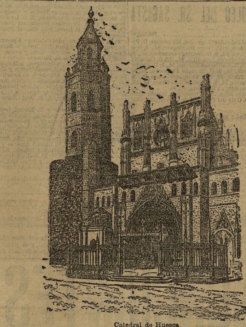
Catedral de Huesca

Cuando se lo devolvían, lamentando el porqué, Don Alfonso contestó alegremente: