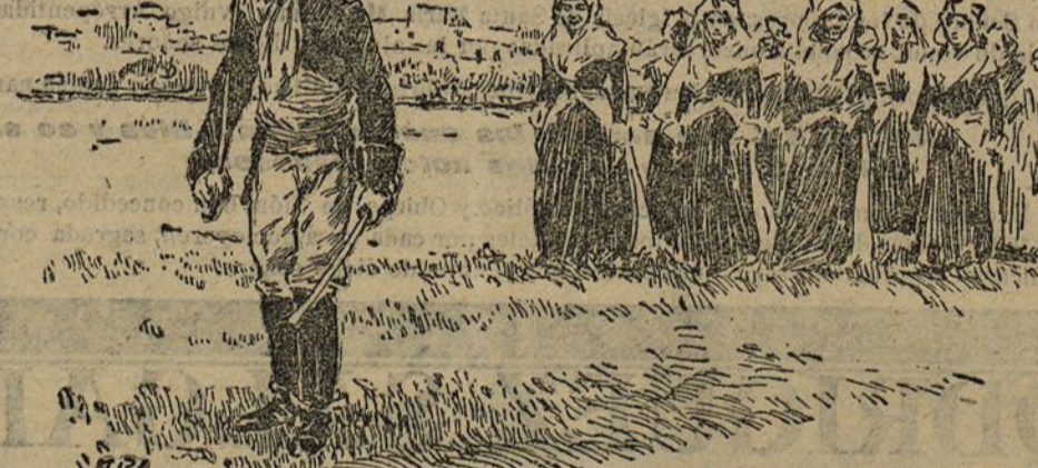
Mad. de Maintenon

En el programa de las prácticas militares de algún tiempo á esta parte viene realizando la Escuela Central de Tiro, de cuyos ejercicios debemos promovernos excelentes resultados para la mayor utilidad de tan importante Instituto, se ha señalado como terreno de experiencias, entre otros de que ya se ha ocupado la Prensa, los conocidos campos de Turégano, de positivo relieve en la historia de nuestra vida militar.