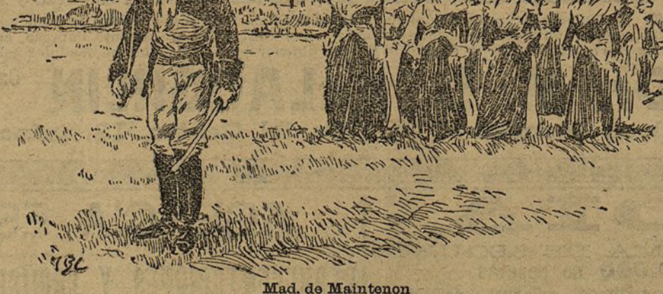
Mad. de Maintenon

Un capricho del acaso da carácter de actualidad a la villa de Turégano, de gran importancia en los tiempos del señorío de los telados, con vestigios aún de sus mejores días, cuando se acogió su iglesia de Santa María del Burgo para celebrar en ella sínodo en 1483, y la designaba el rey Don Juan II para sellar allí gozosamente paces con su favorito D. Álvaro de Luna.