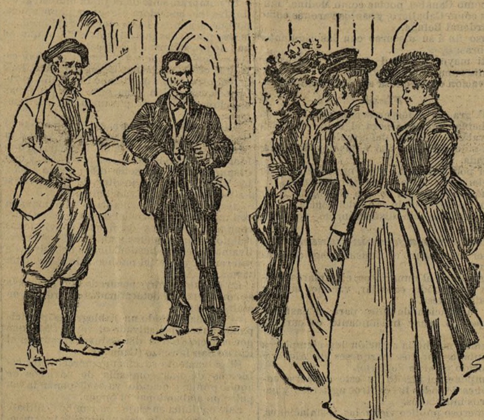
Un caso de curación milagrosa