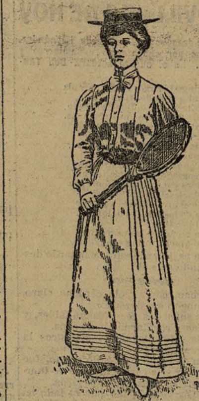
Alicia Roosevelt, hija del Presidente de los Estados Unidos, en traje de lawn-tennis.