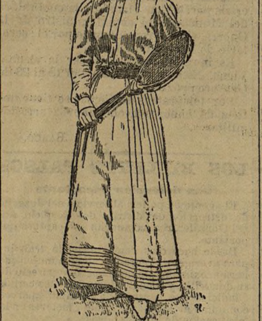
Alicia Roosevelt, hija del Presidente de los Estados Unidos, en traje de lawn-tennis.