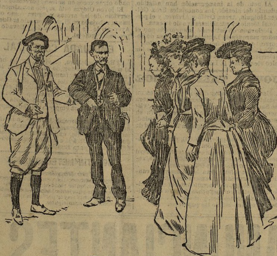
Un caso de curación milagrosa