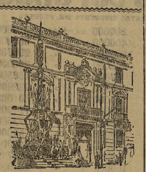
VALLADOLID.—Uno de los trofeos militares colocados frente á la capitanía general, donde se hospedan S. M. y A. A. RR.

ganda; ingenio San José, de Antequera; Azucarera de Villallegre, de Avilés (Oviedo); Azucarera Asturiana, de Yagüé (Oviedo); Azucarera de Lleras, Siero (Oviedo); Santa Victoria, de Valladolid; Nuestra Señora del Pilar, de Gallur (Zaragoza); Azucarera del Rabal, de Rabal (Zaragoza), y Azucarera de Zaragoza, de idem.