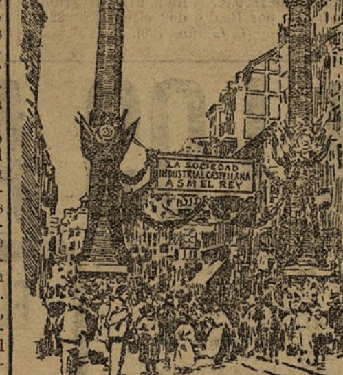
VALLADOLID.—Arco levantado por la Sociedad Industrial Castellana.