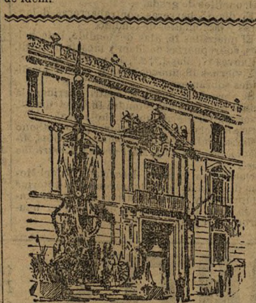
VALLADOLID.—Uno de los trofeos militares colocados frente á la capitanía general, donde se hospedan S. M. y A. A. RR.

ganda; ingenio San José, de Antequera; Azucarera de Villalegre, de Avilés (Oviedo); Azucarera Asturiana, de Verín (Oviedo); Azucarera de Lieres, Siero (Oviedo); Santa Victoria, de Valladolid; Nuestra Señora del Pilar, de Gallur (Zaragoza); Azucarera del Rabal, de Rabal (Zaragoza); y Azucarera de Zaragoza, de idem.