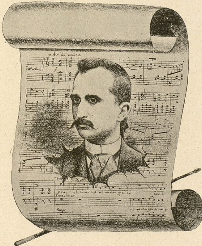
Dibujo de Salvador Diaz.