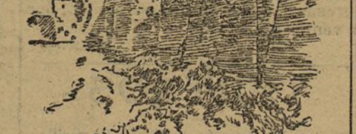
MEDINA DEL CAMPO.—Castillo de la Mota, visitado hoy por el Rey