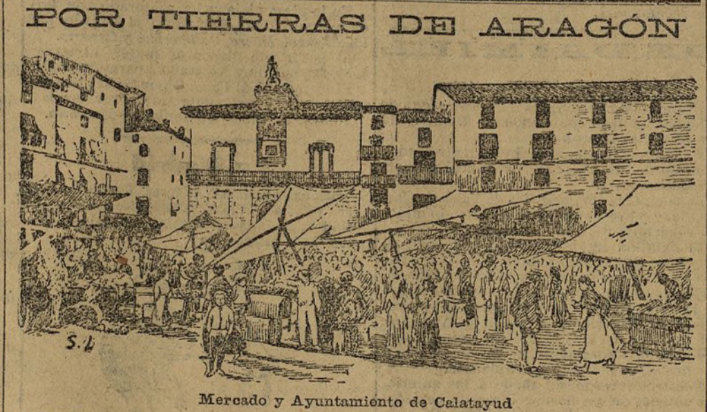
Mercado y Ayuntamiento de Calatayud