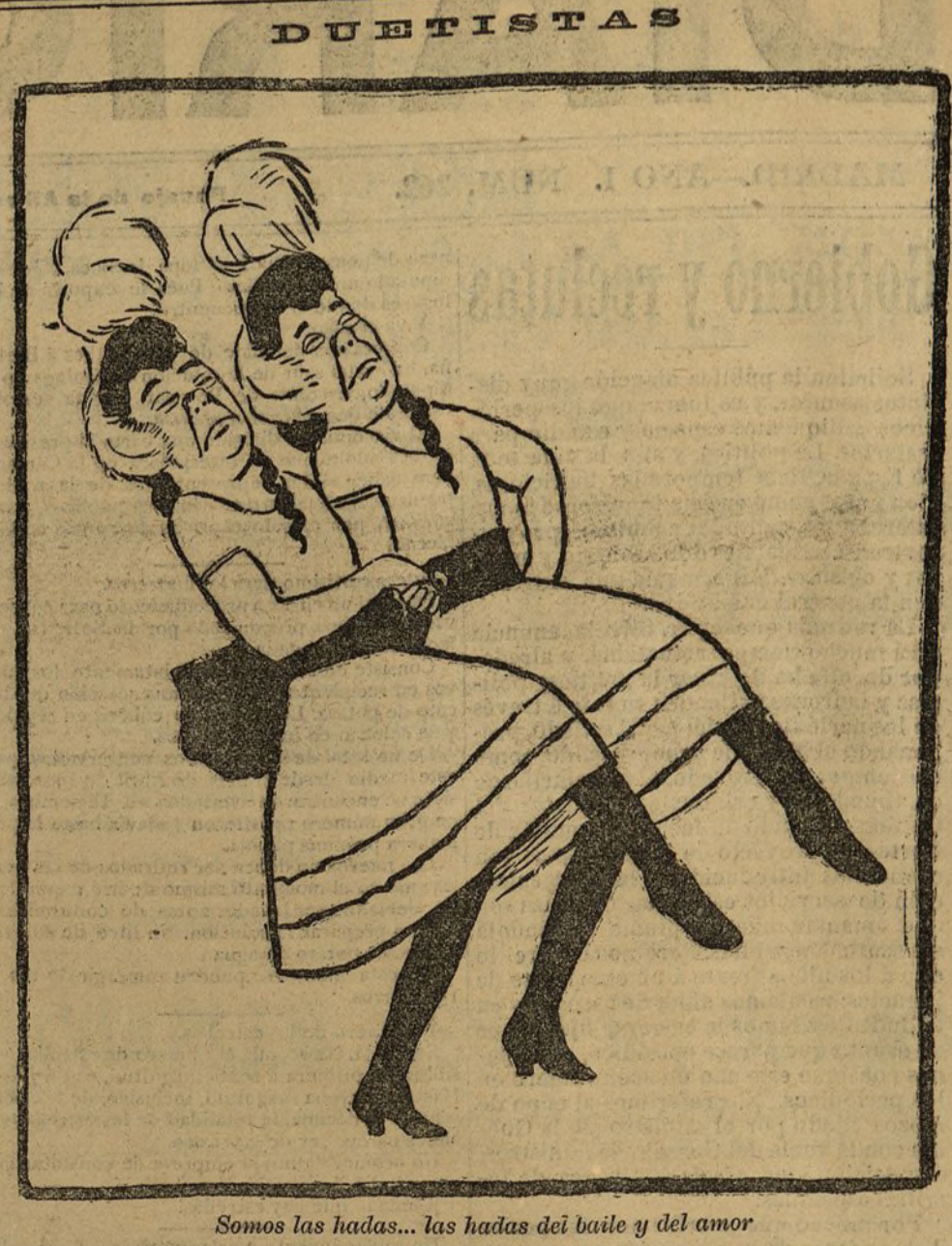
Somos las hadas... las hadas del baile y del amor