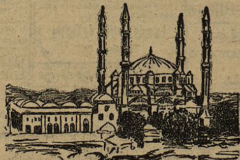
La mezquita del sultán Selim II, en Adrianópolis.