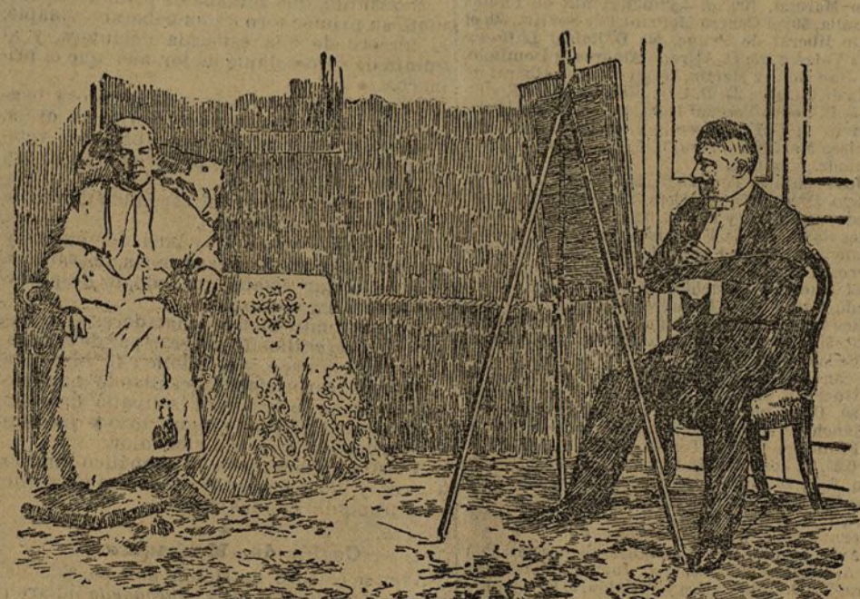
El ilustre Thaddeus, pintando, del natural, la figura de Pío X.

frases pronunciadas por el señor ministro de Marina.