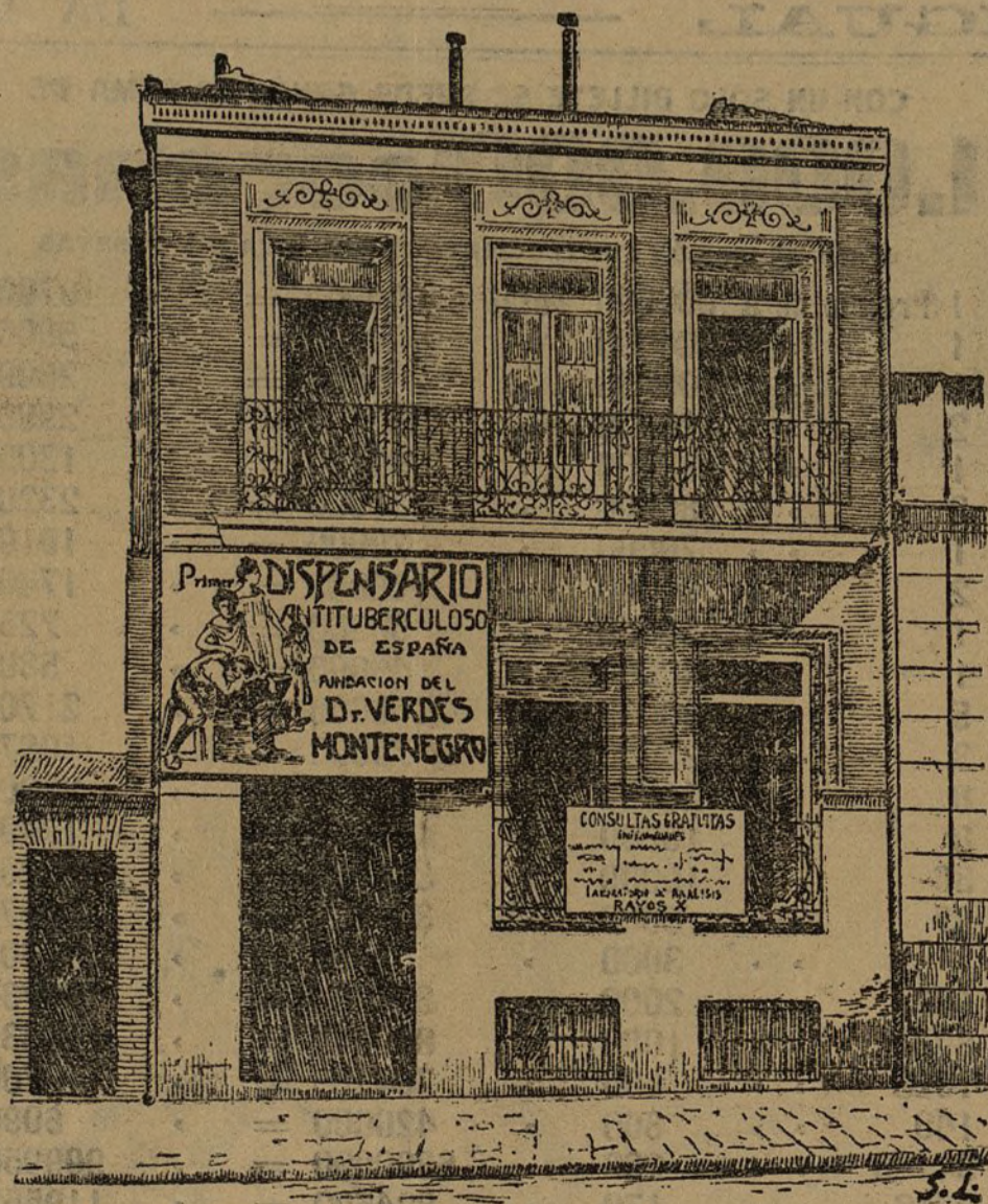
Fachada del edificio donde se ha instalado el Dispensario antituberculoso de Madrid.

idea del estado del enfermo y de las condiciones en que vive, se recoge y anota en las hojas de examen. Se interroga al paciente acerca de la salud de su familia, de la ventilación de la casa que habita, del número de personas que viven con él y de las que duermen en la misma alcoba, etc., etc.; se le pesa, se le talla, se mide su capacidad pulmonar; por medio del espiómetro, al perimetro torácico; se anota el número de sus pulsaciones y de sus movimientos respiratorios, y se completa el estudio del enfermo con los registros y bien conocidos medios de investigación clínica. El examen termina con el análisis de los esputos y con el reconocimiento por medio de los rayos X en la magnífica instalación de radioscopia que posee el Dispensario, y que es una de las mejores de Madrid.