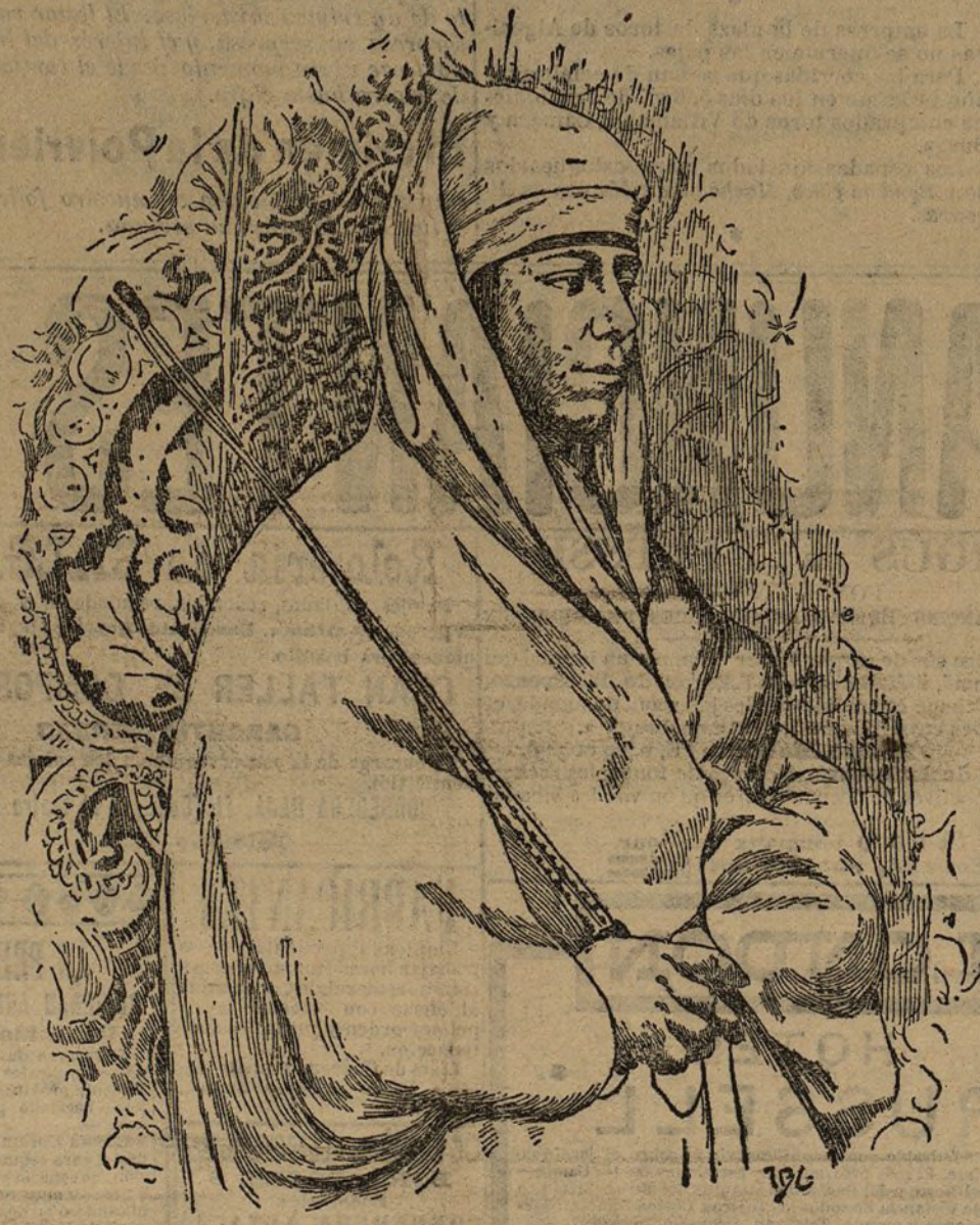
El último retrato del sultán de Marruecos

menos los hombres ilustres que fueron alumnos de esta escuela, que dice ha sido objeto de toda clase de calumnias suponiéndola sin material ni cadáveres para prácticas, resultando que en el último curso ha habido más elementos que en Valladolid y Santiago.