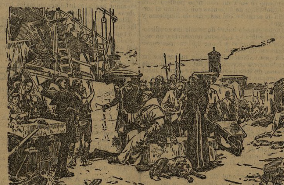
El cardenal Cisneros, visitando las obras del santuario de La Caridad en Illescas, cuadro premiado con medalla de primera clase, de D. Alejandro Ferrant