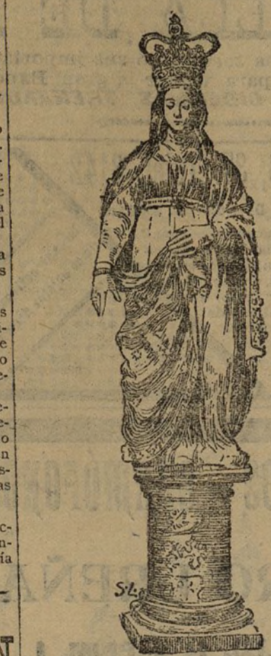
La Virgen de la procesión