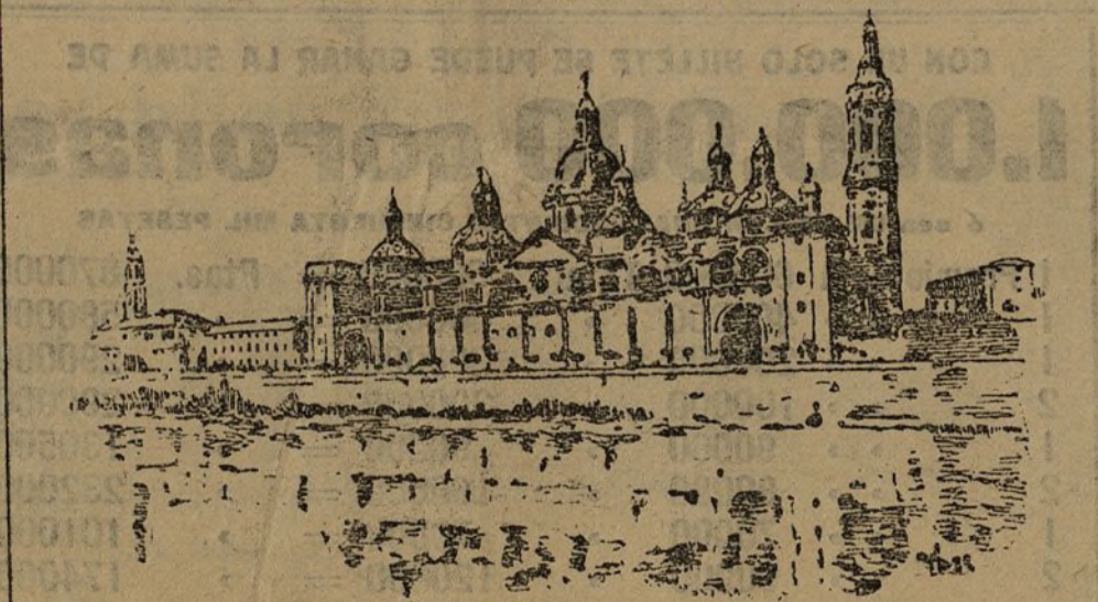
El templo del Pilar