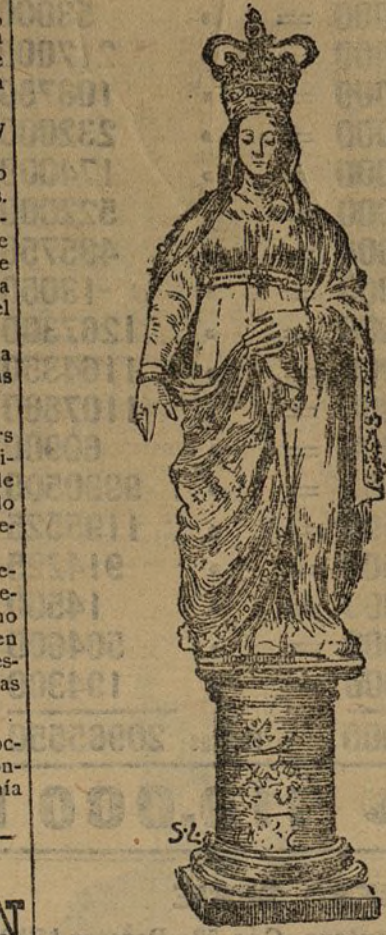
La Virgen de la procesión