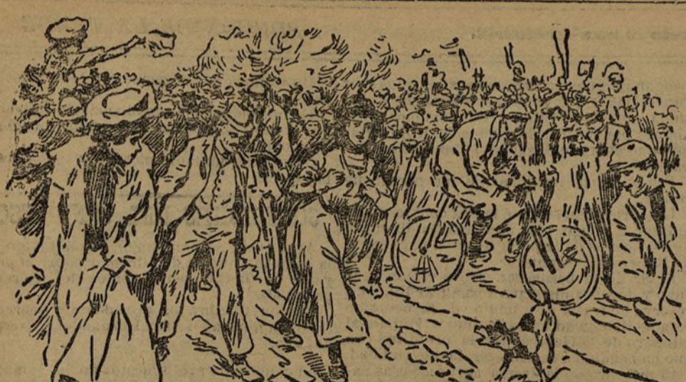
Llegada de la vencedora.

En otro telegrama oficial recibido anoche a las diez en el ministerio de la Guerra, se habla de barricadas y de combates que ocasionaron cuatro muertos y varios heridos. A primera vista parece que esto hecho es el mismo a que se refería la conferencia telefónica celebrada ayer tarde entre el ministro y el gobernador militar de Bilbao. Pero se nos ocurre esta duda: ¿Cómo sobre un hecho comu-