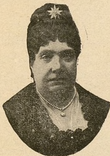
S. M. LA REINA DOÑA ISABEL.

Se publica los días 10, 20 y 30 de cada mes.