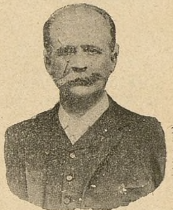
Excmo. Sr. de Radowitz.

Los sentimientos fraternales y de gran cordialidad que á los hijos de Portugal nos unen están afianzados por este notable personaje de méritos indiscutibles, que pertenece á las más linajudas familias de su país.