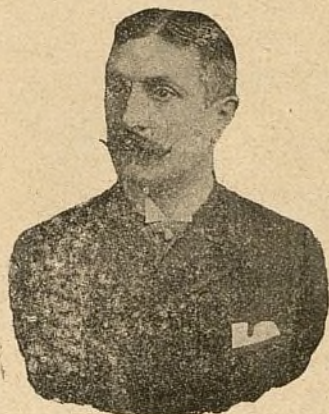
S. E. Mr. Patenotre.

S. E. Mr. Patenotre, Embajador de Francia en España, es una personalidad ilustre estimadísima en la buena sociedad y querida en los centros oficiales.