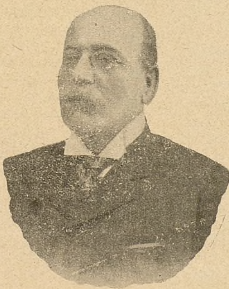
Excmo. Sr. Conde de Macedo.

Al ocuparnos del Excmo. Sr. Conde de Macedo, Ministro Plenipotenciario de Portugal en España, cúmplenos hacer notar que es el más acabado prototipo de la caballerosidad lusitana.