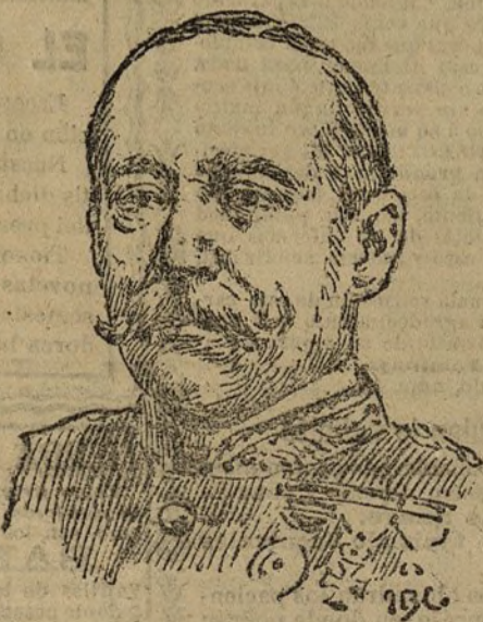
El general marqués de Polavieja, nuevo jefe del Cuartel militar del Rey

Un viajero dijo haber descubierto recientemente en Venezuela, en las cercanías de Imataca, una cascada de 488 metros de altura.