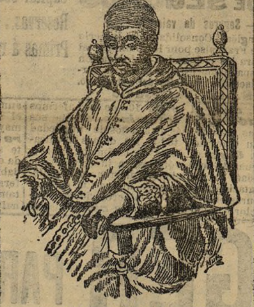
El cardenal Gil de Albornoz, fundador del Colegio

Dos distinguidos ex-colegiales de San Clemente de los Españoles, D. Pedro Borrajo y