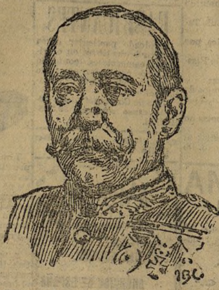
El general marqués de Polavieja, nuevo jefe del Cuarto militar del Rey

Un viajero dijo haber descubierto recientemente en Venezuela, en las cercanías de Imataca, una cascada de 488 metros de altura.