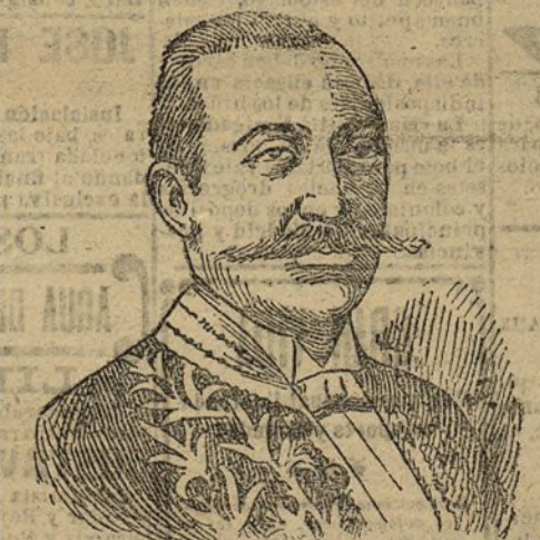
El general Reyes

Enviado extraordinario de Colombia en los Estados Unidos.