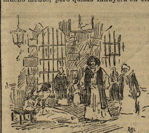
Acto segundo: en la prisión