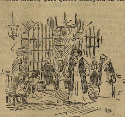
Acto segundo: en la prisión