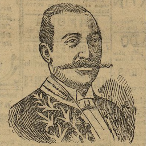
El general Reyes Enviado extraordinario de Colombia en los Estados Unidos.