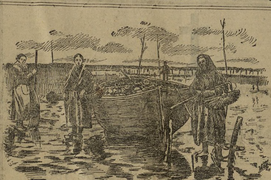
Pescadoras de sardinas en Galicia