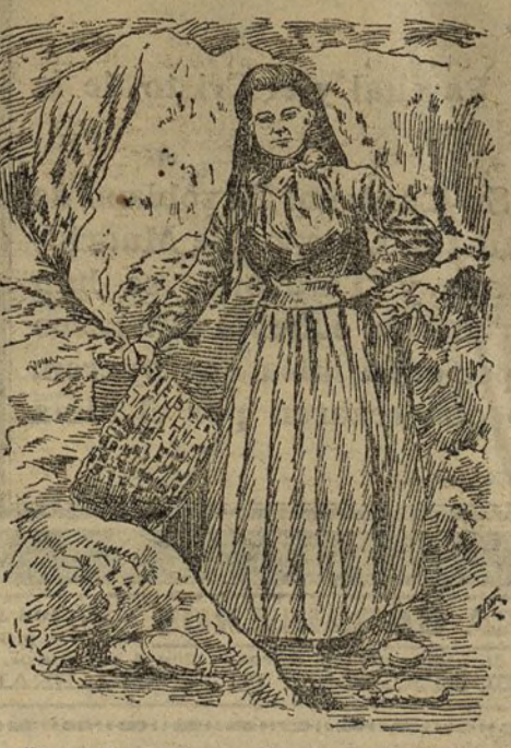
Pescadora de sardinas de Bretaña

Por los impracticables desfiladeros del Rhodope ó del Schar-Dagh, llevaban a los combatientes