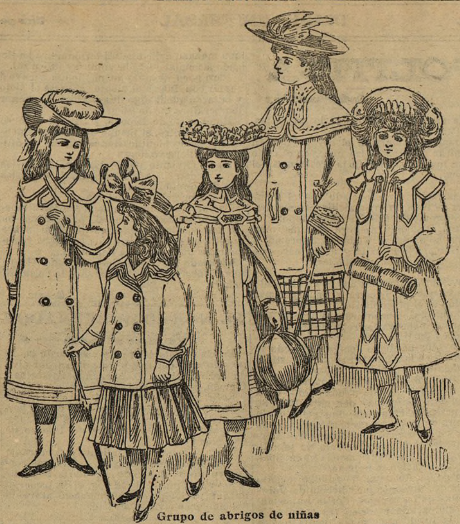
Grupo de abrigos de niñas

Con ocasión de la siega que hemos padecido me escribe un discreto labrador, y entre otras cosas no menos sustancioso,