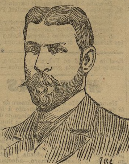
D. Antonio Mollada, fiscal del Tribunal Supremo

La atracción política que trajo consigo su temprana independencia y la atracción económica que fomentó el nuevo tratado de reciprocidad comercial, pone a Cuba a merced de los norteamericanos. Esta es una verdad que, por mucho que nos pese, no debemos desconocer los españoles. Es más, y aun que parezca un verdadero colmo, los españoles que residen en la isla, lejos de temer esa aproximación, la ayudan y la fomentan. Unos, porque son hacendados y ambicionan la venta en buenas condiciones del azúcar y el tabaco; otros, porque son comerciantes y encuentran más facilidades para proveerse en los Estados Unidos que en España, y otros, porque, halagados hoy por los yanquis, creen que lo serán mañana; sin pensar que, así como se sirvieron de los criollos contra nosotros, se sirven ahora de los españoles contra los cubanos; todos, por una u otra causa, cooperan a esa obra de destrucción del elemento nacional y del triunfo de la americanización de Cuba. El tratado de reciprocidad comercial es el arma más poderosa que han podido esgrimir los americanos; es el golpe de muerte del mercado europeo en el monopolio del nuevo señor, del poderoso yanqui.