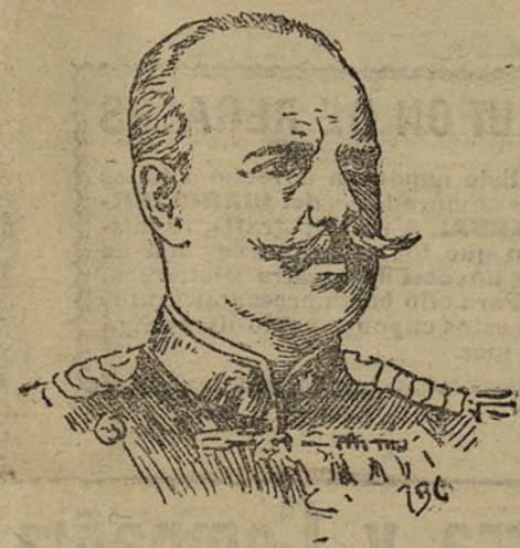
El infante D. Alfonso de Portugal

El motor es eléctrico y desarrolla una velocidad de siete kilómetros por hora, y el conductor y dueño tiene seis años de edad.