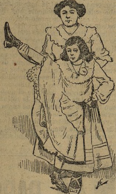
La profesora "abriendo" a una discípula de diez años

Lo que menos se enseña allí es a bailar.