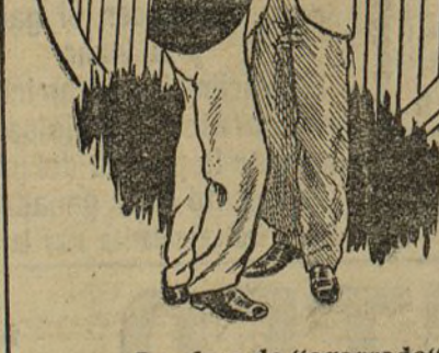
La clase de "agarrado"

una información de esta academia. ¿Es usted la profesora?