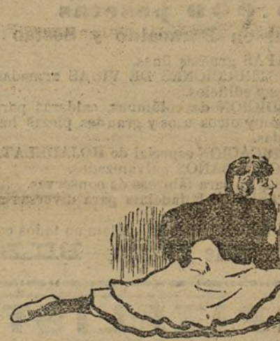
Tiempo de can-can

La criatura inocente que pisa aquel suelo se despoja de sus buenas inclinaciones y busca la notoriedad y el dinero en la exhibición vergonzosa y en la contorsión indecente. Allí, repito, la educación consiste en lograr que las