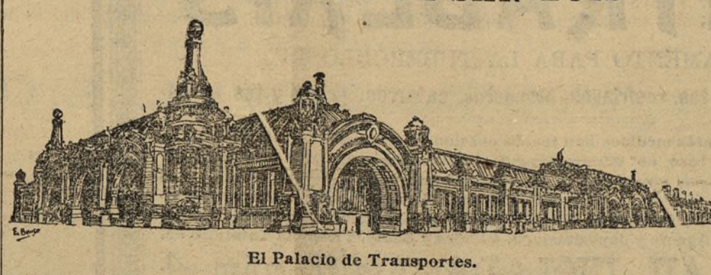
El Palacio de Transportes.

ducido los mejores resultados, consistentes en varias estatuas, admirables pavimentos, etcétera, etc. Por los estudios hechos hasta ahora sobre las obras descubiertas, creése que tales hallazgos denotan que Baena, en la antigüedad, debió ser destruida por un incendio, probablemente producido por los vándalos. Los académicos admiraron fotografías de las obras descubiertas, y confiaron al señor Amador para que, respecto de ellas, escribiese una Memoria.