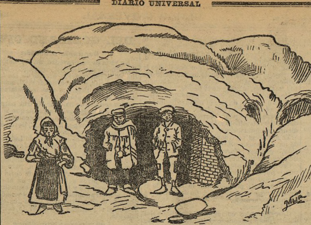
La cueva número 3

Y, por último, que la avena, por sus hermosas condiciones mejorantes, es el último lugar de una rotación de cosecha a