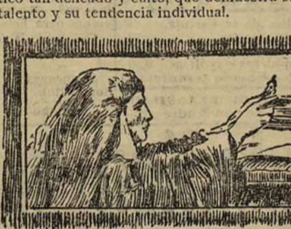
Condesa de Alto-Mearim.

La condesa de Alto-Mearim es de las que más se destacan por sus dotes de espíritu. En sus concepciones artísticas se encuentra un sentimiento estético tan delicado y culto, que demuestra su gran talento y su tendencia individual.