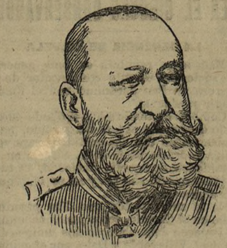
El almirante Alexeieff general en jefe de las tropas rusas en el extremo Oriente

Porque aun cuando el asunto es complicado, hay en ambos campos propósitos de paz, personificados precisamente en los soberanos de los dos países interesados. El zar y el emperador japonés están decididos a poner cuanto haya a su alcance para evitar a sus pueblos los horrores de la guerra. En San Petersburgo, el conde Lansdorff trabaja en pro de una solución amistosa, y pone al servicio de esa idea toda su gran influencia