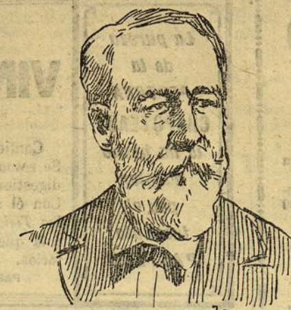
M. Brisson, nuevo presidente de la Cámara francesa