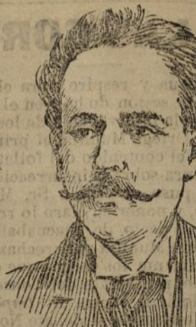
Aparicio Saravia Comandante en jefe de las fuerzas revolucionarias