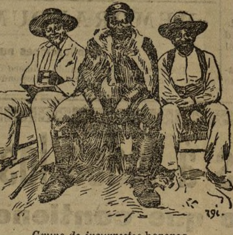
Grupo de insurrectos hereros

gento joven, mientras algunos políticos posibilistas al compás de la música, la marquesa de Squilache recibía muchas felicitaciones por su espléndido donativo a los niños del Hospicio.