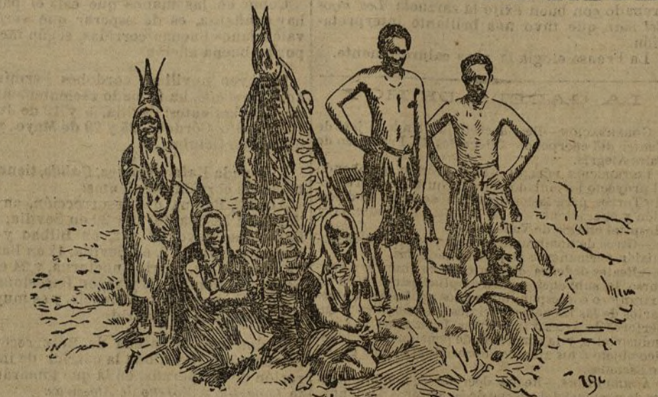
Tipos de Bondelzwarts refugiados en las orillas del río Orange, sometidos a los alemanes.