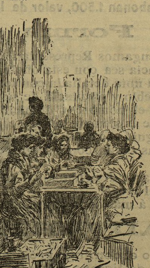
A Dios lo que es de Dios, y a la Tabacalera lo que es suyo.

Compañía es porque no abandona a las infelices cigarreras que se inutilizan después de muchos años de trabajo. Las que se quedan ciegas ó que padecen dolencias graves contraídas allí, pasan al pabellón de despalilladoras, y se ganan su jornal arrancando las vёрtebras de las hojas del tabaco.