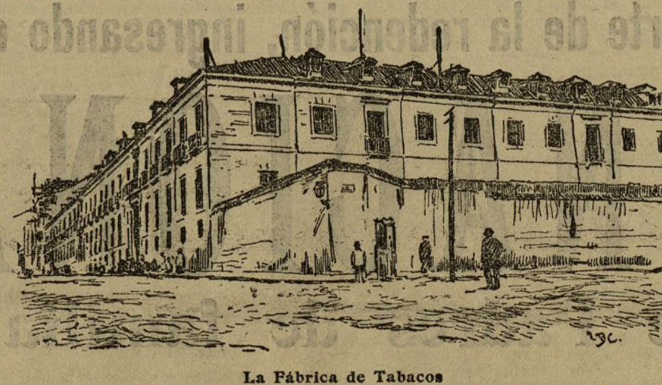
La Fábrica de Tabacos

—¿Entrar en la Fábrica de Tabacos? ¡imposible! —Pues hombre, ¿qué tiene eso de particular? —Nada, nada; es inútil que pretenda usted ver aquello. No lo ha conseguido nadie. —¿Qué atrocidad! ¿Y pidiendo permiso? —¡Inténtelo, pero me parece... Y, efectivamente, solicitamos autorización para penetrar en la Fábrica, y a los tres días nos contestaron con la negativa más rotunda. Y nosotros, que creíamos sólo difícil hincar un perro, nos encontramos sorprendidos por la decisión tabacalera. Por qué no querían dejarnos pasar a la Fábrica? Según el director del establecimiento, porque reinaba alguna excitación entre las operarias y nuestra visita podía originar sin duda