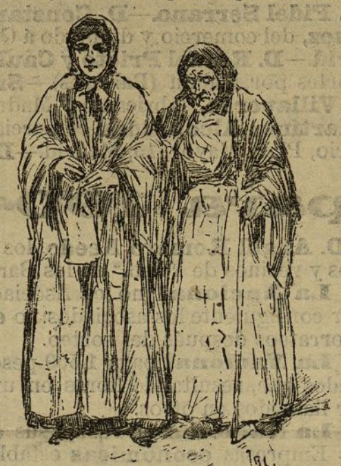
Una anciana «despalilladora» conducida por otra cigarrera

—¿Entrar en la Fábrica de Tabacos? ¡imposible! —Pues hombre, ¿qué tiene eso de particular? —Nada, nada; es inútil que pretenda usted ver aquello. No lo ha conseguido nadie. —¿Qué atrocidad! ¿Y pidiendo permiso? —¡Inténtelo, pero me parece... Y, efectivamente, solicitamos autorización para penetrar en la Fábrica, y a los tres días nos contestaron con la negativa más rotunda. Y nosotros, que creíamos sólo difícil hincar un perro, nos encontramos sorprendidos por la decisión tabacalera. Por qué no querían dejarnos pasar a la Fábrica? Según el director del establecimiento, porque reinaba alguna excitación entre las operarias y nuestra visita podía originar sin duda