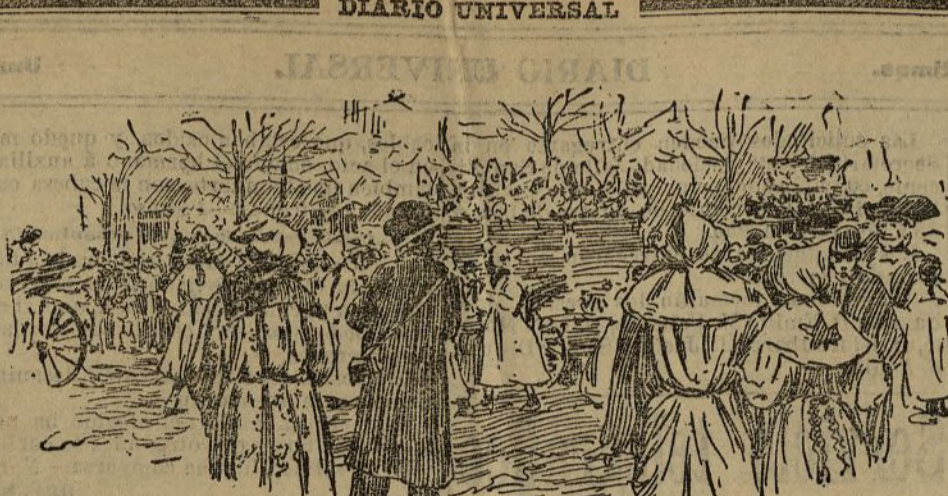
En la plaza de Colón

Se excita en este documento a todos los franceses de las colonias y residentes en el extranjero a que observen estrictamente los deberes que imponen las leyes de neutralidad.