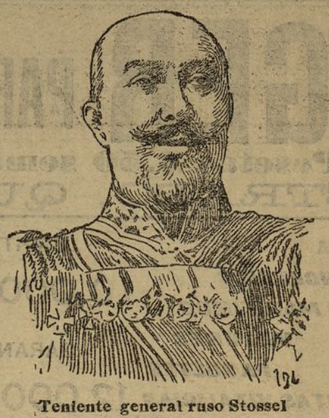
Teniente general ruso Stessel Comandante de Puerto Arturo

Resultó excesiva la prudente desconfianza con que se acogieron nuestros informes referentes al bombardeo y destrucción de Hakodate por los cuatro cruceros rusos Rurik , Gromoboi , Rossia y Hogatir , que forman la escuadra de Vladivostok. Está probado, pese a la reserva ladina que el Mikado viene mostrando desde la ruptura de hostilidades, que el bombardeo se realizó, aunque se ignora