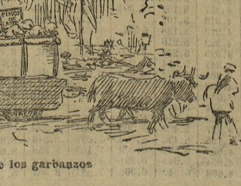
Carroza de los garbajos

El día está desahogado. Sopla un fuerte viento, que proporcionará seguramente al público bullanguero grandes catarros y tal vez alguna pulmonía.