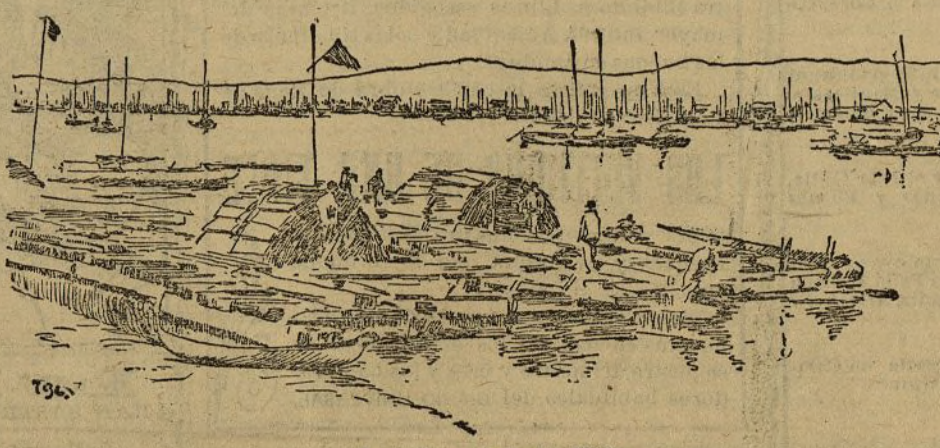
A orillas del río Yalu