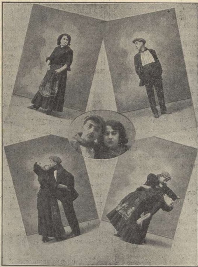
Los celebrados PRETZMAN

Mucho y muy bueno habíamos visto hacer en Cádiz sobre las llamadas barras fijas ó torniquetes, más nunca alcanzó á lo que pudiéramos calificar de filigranas gimnásticas , ejecutadas por "Los Faterson"