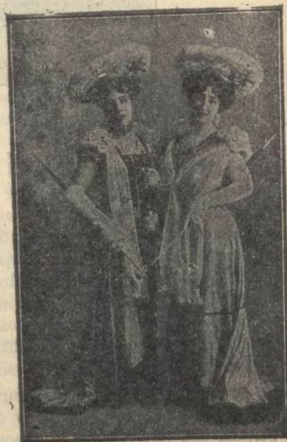
Las celebres gimnastas HERMANAS MARIANOS

Abrió de nuevo al público sus puertas el decano de nuestros coliseos, y ciertamente podemos asegurar que jamás presenciaremos aquí un conjunto de artistas tan notables como el que nos ofrece la Com-