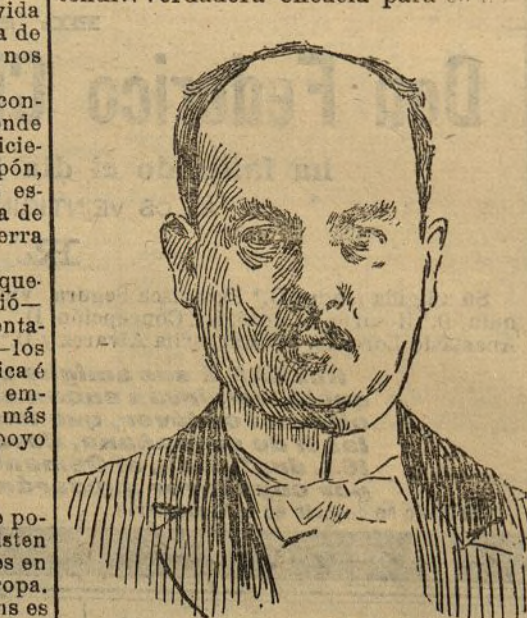
Conde de Lamsdorff Ministro de Estado de Rusia

Esta noticia, que nosotros esperamos (véanse nuestras impresiones de ayer), tendrá verdadera eficacia para con