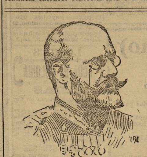
El almirante Skrydlow que ha reemplazado al vicealmirante Oscar Stark en el mando de la marina rusa

Mencarini y su amigo quisieron convencer al centinela de lo injustificado de su pretensión, desconocida y no practicada en parte alguna, y aun pretendiendo seguir adelante, el centinela entonces echóse el fusil a la cara