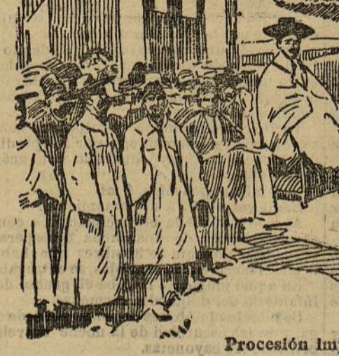
Procesión imperial en Seúl

decirlo así, la lengua del pueblo, mientras que el idioma chino es la lengua oficial para los estudios, la diplomacia y las clases superiores. Estas gozan de privilegios grandes, y la nobleza coreana se separa de las categorías inferiores del pueblo con una barrera casi igual á la de las castas en la India. El traje, la lengua, las costumbres y hasta la escritura, asientan al señor del siervo.