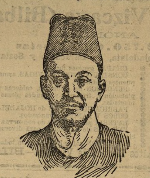
El emperador de Corea

La Corea, por su misma situación geográfica, aun haciendo caso omiso de la fertilidad de su suelo y de las riquezas de su subsuelo,